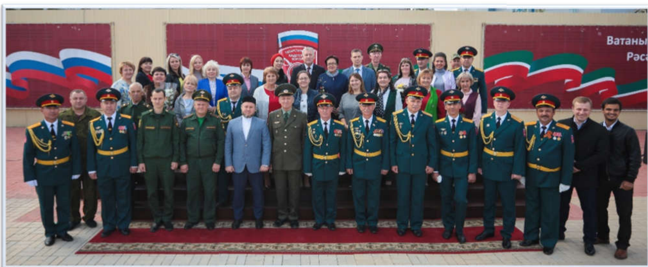
Коллектив Татарстанского кадетского корпуса ПФО им.Героя Советского Союза Гани Сафиуллина